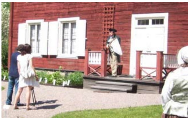
För Rysslands Kanal 1!