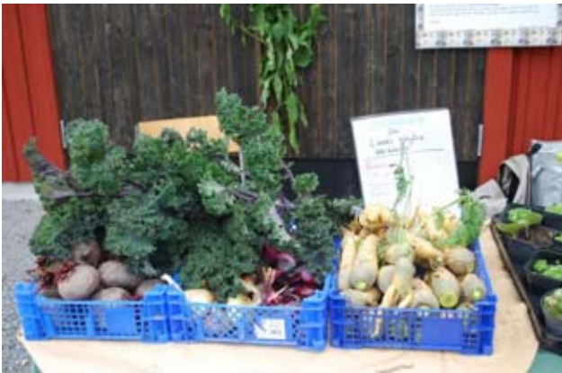
Trädgårdsprodukter från Hammarbys eget kålland såldes: frodiga rödbetor, morötter, lök, potatis och grönkål samt plantor av bl.a. hasselört.