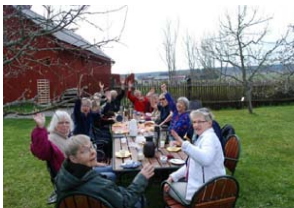
Kaffe och hembakad jordgubbstårta i äppelträdgården.