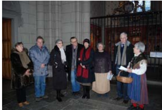
Deltagarna vid minnesstunden.