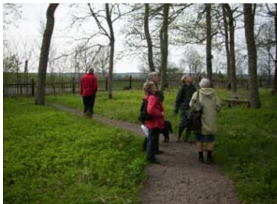
Är holken bebodd måne?