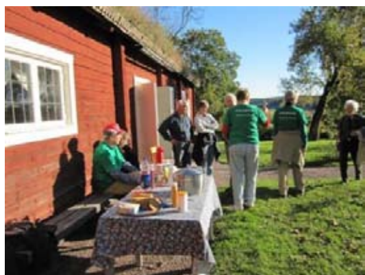
Samling till ärtsoppa.

Sista dagen i september stängdes Hammarby för säsongen och då väntar vintervilan tills trädgården tar emot besökare den 1 maj nästa år. Traditionsenligt slöt många medlemmar upp för att hjälpa till att rensa sly, klippa körvel och plocka undan nedfallna grenar. Trädgården och parken är stor, så det är väl inte så mycket vi kan bidra med, men det ser i alla fall litet trevligare ut, där vi dragit fram och avlägsnat vad som inte hör dit.