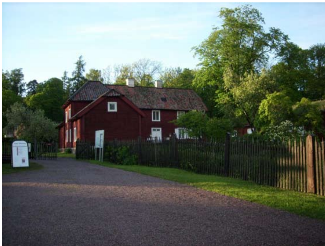
Hammarby efter regn en mild försommarkväll.

Jesper Kårehed Uppsala linneanska trädgårdar