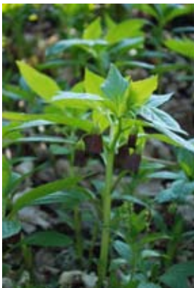
Skogsbingel under dårört.