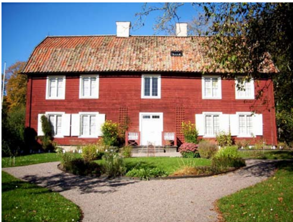
Hammarby inför vintersömnen.