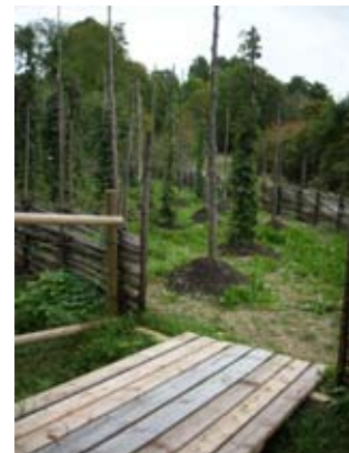
Den nyanlagda humlegården.