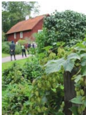
Humle vid äppelträdgården.