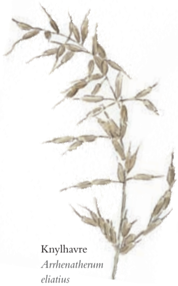
Knylhavre Arrhenatherum eliatius